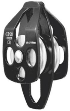
Poleas de Rescate