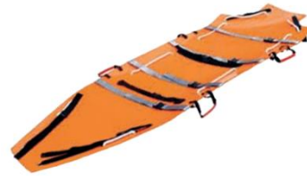
Canastilla Enrollable de Rescate