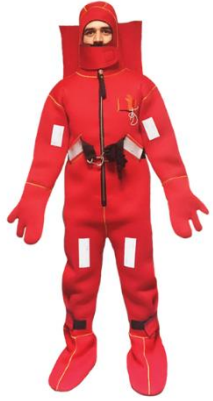
Traje de inmersión en Aguas Gélidas