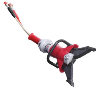
Herramienta Combinada Hidráulica