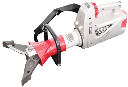
Herramienta Combinada Eléctrica